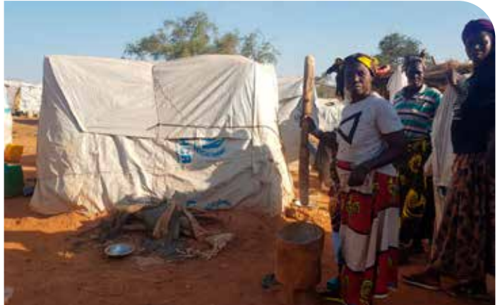
Binnenflüchtlingslager in Burkina Faso

Die Hauptursachen für die Vertreibung sind Gewalt und Konflikte, die von militanten islamistischen Gruppierungen angeführt oder verursacht werden. In der zentralen Sahelzone sind die islamistische Gruppe