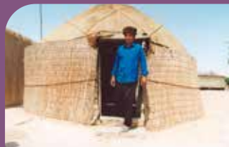
Mann in Zentralasien vor seiner Jurte

Eintritt frei, Spendenmöglichkeit für ein Projekt zur Unterstützung von Christen in Zentralasien