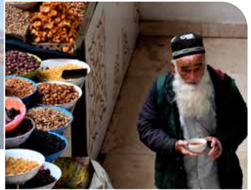
Markt in Zentralasien